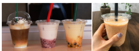
ドリンク おすすめ↑ ハニートマト↑

売しております! もちろんソフトクリームも販売しています。皆様お待ちしております!